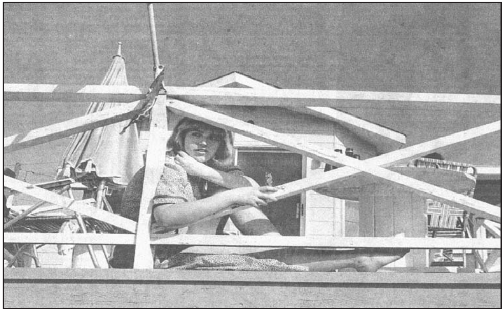
Φωτογραφία: Cindy Sherman