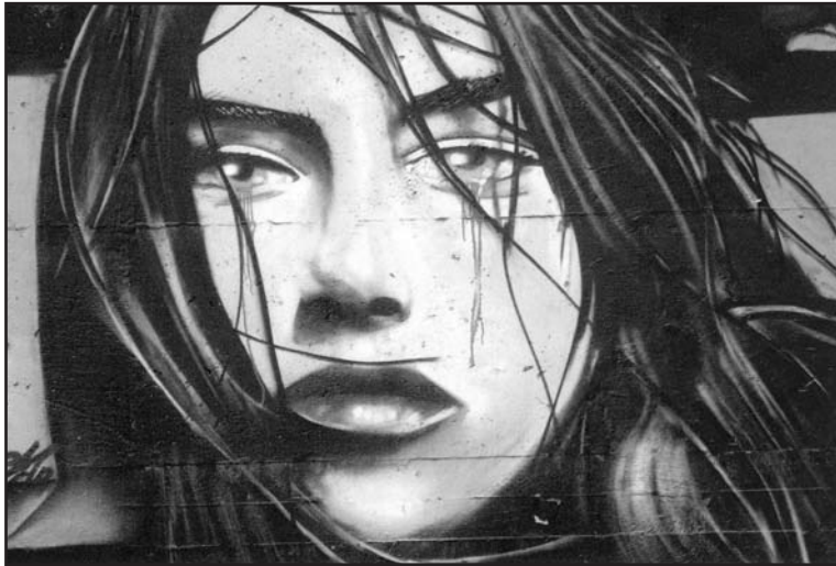
Εικονογράφηση: Lukas Therop

Η υγρασία κι η μυρωδιά της ανθρώπινης σάρκας έχει ποτίσει τους τοίχους, το ξύλινο πάτωμα, τις λεκιασμένες κουρτίνες. Τα πάντα αναδίδουν μian λιγωτική σαπίλα. Το ροζ φως της λάμπας που κρέμεται γυμνή από το ταβάνι δημιουργεί βαριές σκιές που κωρίζουν το δωμάτιο σε πολλά επίπεδα μέχρι το τελικό βύθισμα σ' ένα μεγάλο, μισοδιαλυμένο κρεβάτι με μοβ σκεπάσματα. Απέναντι η τηλεόραση, δίπλα το μπαρ και μια παράταιρη πολυθρόνα από κόκκινο ύφασμα.